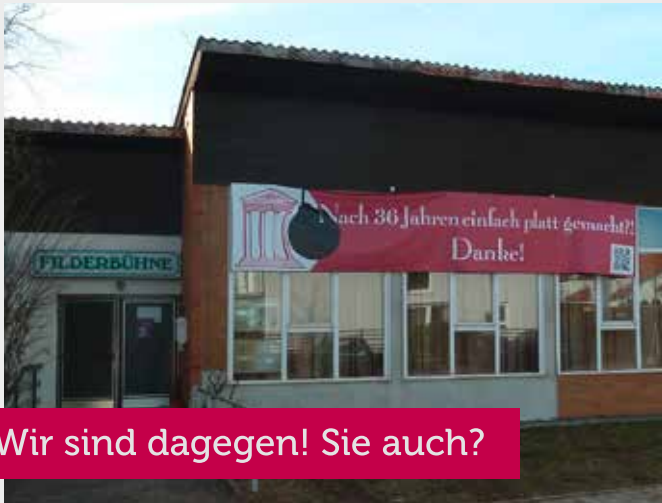
Wir sind dagegen! Sie auch?

Bitte E-Mails /Newsletter (2-4 mal jährlich) zusenden.