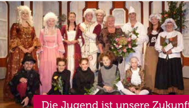
Die Jugend ist unsere Zukunft!